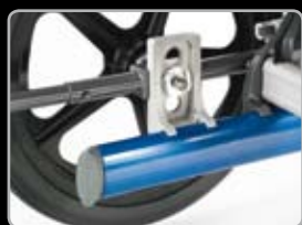
Altezza della seduta regolabile