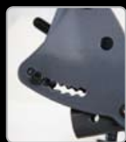
Angolo schienale regolabile