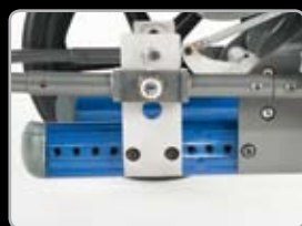
Altezza della seduta e asse regolabile