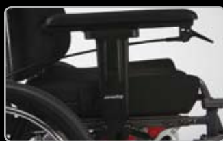
Disponibile con opzione autobasculante