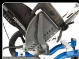
Profondità seduta e schienale regolabile