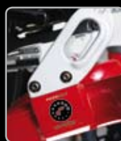
Gancio per trasporto