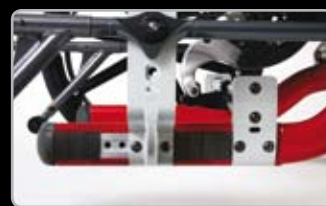
Altezza della seduta e asse regolabile