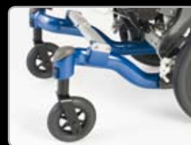
Ampia scelta di pneumatici e ruote